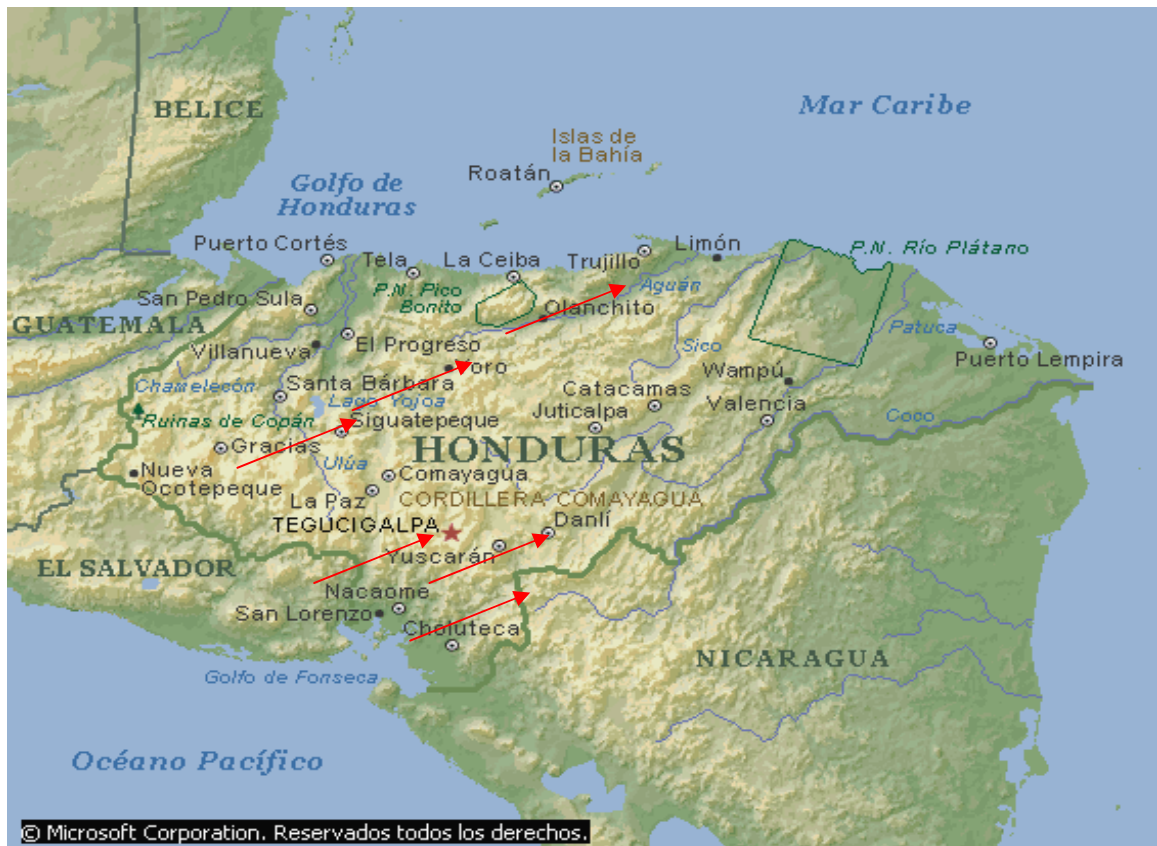
Mapa de Honduras indicando áreas de trabajo de la Misión Metodista Unida

El territorio de Honduras está dividido en 18 departamentos, 298 municipios, 3.828 aldeas y 30.810 caseríos. Tiene una población aproximada de 7.028.389